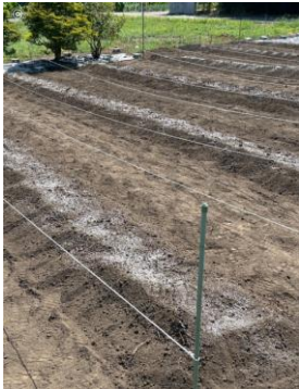
【写真⑨】 令和6年8月8日・9日

畑にロープを張り設計 図通りに畝を作りまし た。 写真の畝はジャガイモ 用です（6畝）